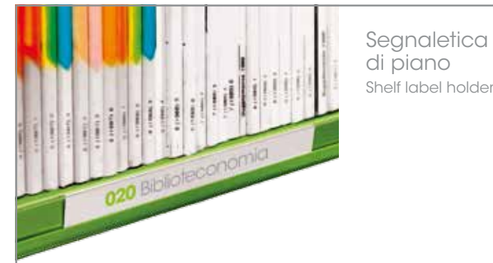
Segnaletica di piano Shelf label holder