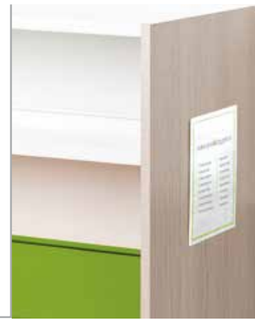
Segnaletica per fianco Signage board for shelving sides