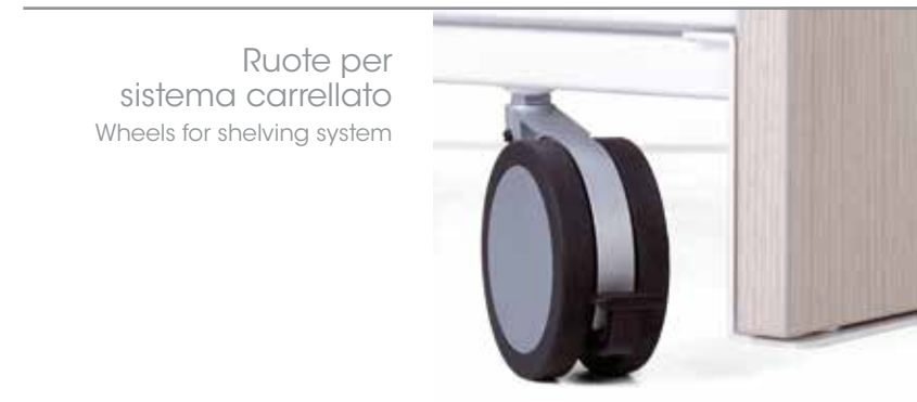
Ruote per sistema carrellato Wheels for shelving system