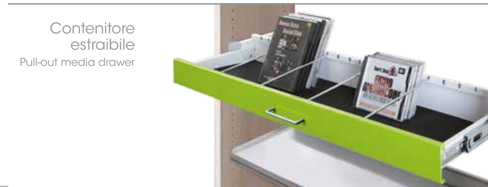
Contenitore estraibile Pull-out media drawer