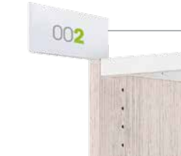
Segnaletica a bandiera Labelling flag