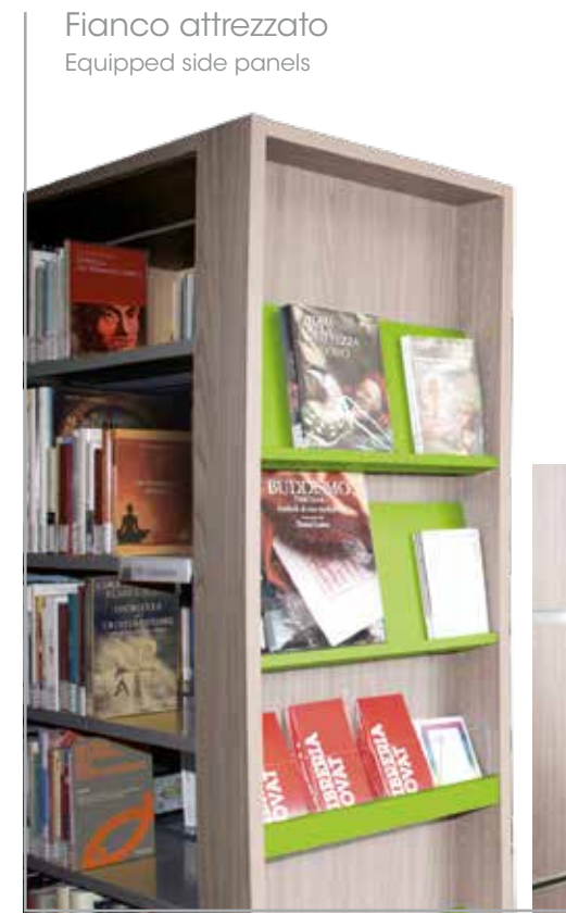
Fianco attrezzato Equipped side panels