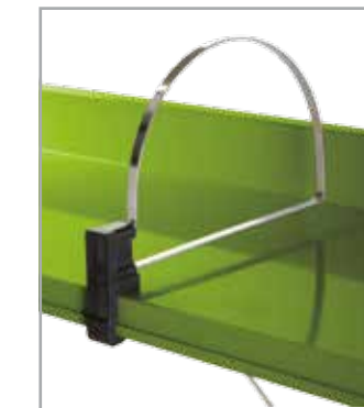
Fermalibri ad arco Arch-shaped book support