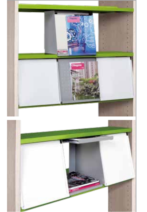
Espositore/contenitore riviste orizzontale Magazine storage and display box