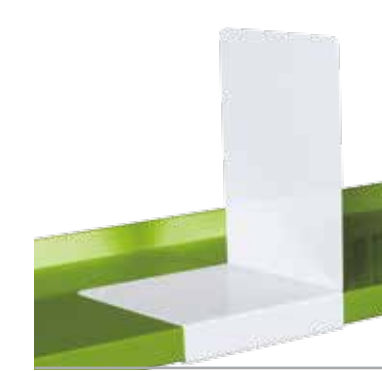
Fermalibri a L L-shaped book support