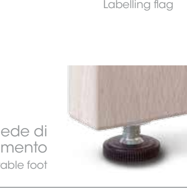
Piede di livellamento Adjustable foot