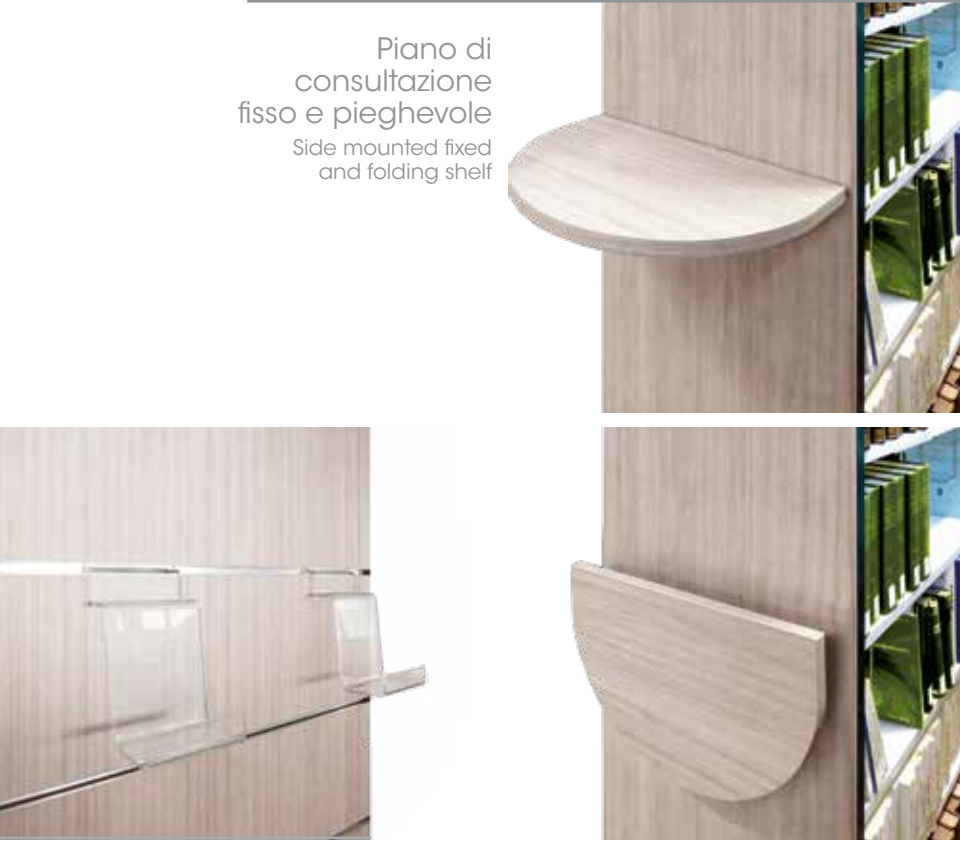
Piano di consultazione fisso e pieghevole Side mounted fixed and folding shelf