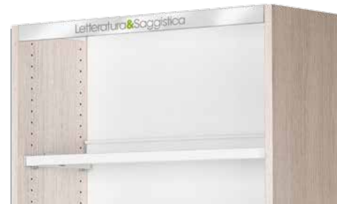
Segnaletica per top Shelf-top signage