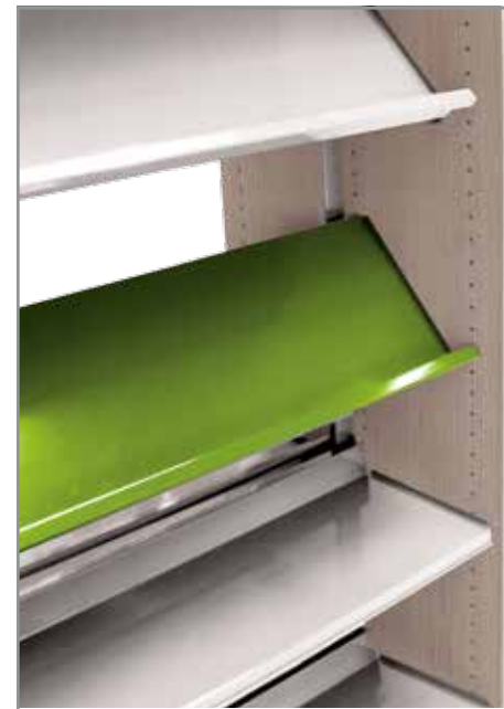
Piano orizzontale e piano inclinato Flat and display shelf